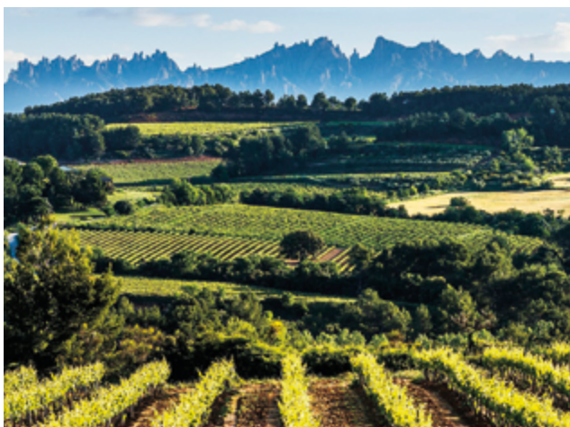
Vinyes de l'Alt Penedès

La comarca de l'Alt Penedès es regeix pel patró paisatgístic de la vinya, la qual, a través de la indústria del vi i del cava i dels clústers associats, genera un teixit socioeconòmic particular.