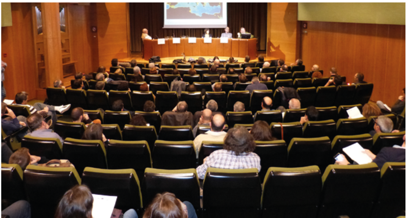
Sessió de presentació del projecte CLINOMICS