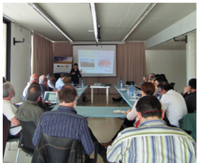
Reunió de treball de la MeTACC Montseny

La MeTACC Montseny es va constituir el 6 d'abril de 2017 al municipi del Montseny amb la participació d'una trentena d'actors locals vinculats amb el CLINOMICS. En aquesta primera reunió es va explorar «la visió del Montseny que volem i podem crear» tenint en compte els reptes que planteja el canvi climàtic. Es va poder recollir un ampli consens sobre la necessitat d'avançar vers un desenvolupament sostenible al Montseny que permeti preservar-lo i en promogui la biodiversitat, però alhora sense descuidar la creació d'un territori viu, humanitzat, ric i equilibrat. A la segona reunió celebrada al Figaró-Montmany el 13 de juny, els participants van construir un mapa o model a partir dels impactes del canvi climàtic i elements del territori focalitzats en els sectors objecte del projecte. Aquesta reflexió conjunta sobre la relació entre impactes del canvi climàtic, elements més vulnerables i elements motor clau pels sectors primari i turístic és el punt de partida per començar a treballar accions concretes d'adaptació al canvi climàtic en la següent reunió, prevista pel mes d'octubre.