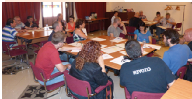
Reunió de treball de la MeTACC Alt Penedès

El 6 de juliol es va dur a terme la segona MeTACC en la que els mateixos participants van donar a conèixer als assistents, els seus projectes i experiències en canvi climàtic que van obrir les portes al treball grupal i posada en comú sobre els tres riscos treballats a la sessió.