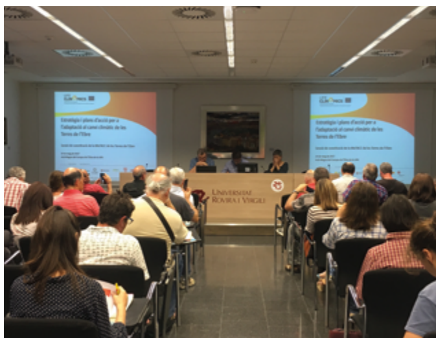
Reunió de treball de la MeTACC Terres de l'Ebre

Per aquesta raó, des de la Reserva de la Biosfera de Terres de l'Ebre, des del seu ens gestor (COPA-TE) i els actors locals que van impulsar-la, estem