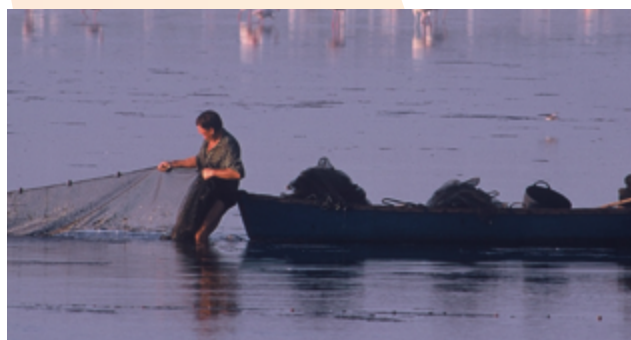
Pesca al Delta de l'Ebre

Tot plegat permetrà elaborar, el 2018, l'Estratègia i el Pla d'Acció per a l'adaptació al canvi climàtic de les Terres de l'Ebre i prioritzar les accions pilot i demostratives que contempla Life Clinomics.