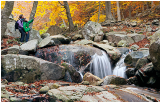
Reserva de la Biosfera del Montseny

La implementació del projecte CLINOMICS a la reserva de la biosfera del Montseny ha permès, d'entrada, aprofundir en els efectes del canvi climàtic sobre aquest territori. Els indicadors mostren que l'augment de temperatures, la disminució dels cabals d'aigua dels rius i la reducció de les superfícies i/o durada de les zones cobertes de neu apareixen com els riscos amb una vulnerabilitat més elevada, els quals afecten directament els sectors forestal, agroramader i turístic. L'increment del risc